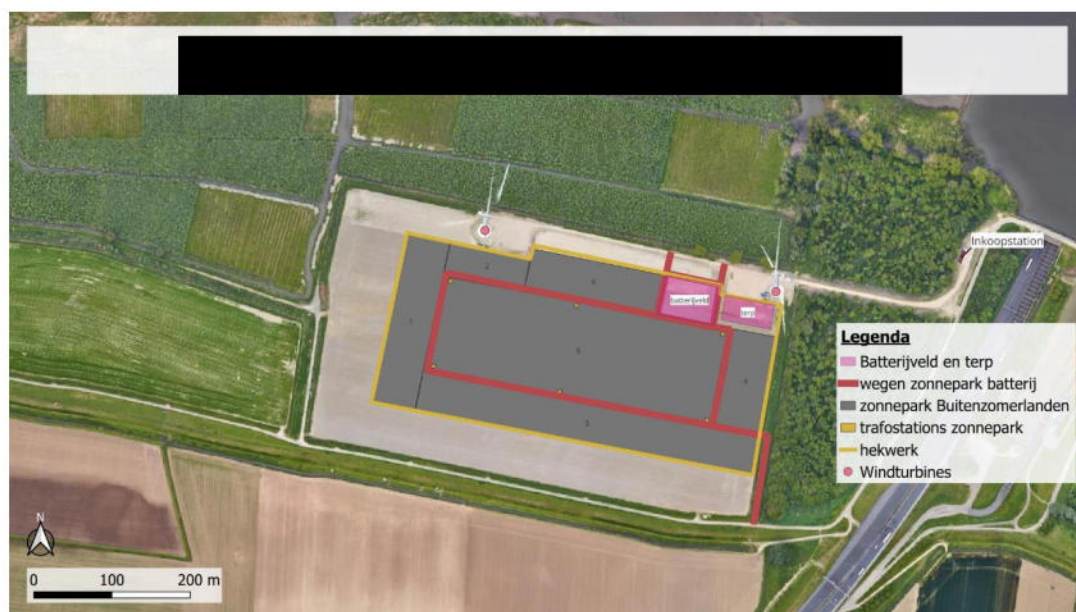
Figuur 1: Indicatieve lay-out van het bestemmingsplan Buitenzomerlanden

Er komt een 4,5 meter brede weg rondom het EOS-park om voldoende manoeuvreerruimte te garanderen voor servicevoertuigen en brandweerwagens, zoals voorgeschreven in de PGS 37. Daarnaast wordt tussen de batterijmodules en rondom de omvormers en transformatoren een veiligheidszone gereserveerd, conform de eisen van de PGS 37. De veiligheidsdienst vereist een maximale blusafstand van 60 meter, wat op deze manier wordt gerealiseerd. De locatie van het wateraansluitpunten (hydranten) worden nader bepaald. In Figuur 1 is de indicatieve lay-out van het gehele landschapsplan weergegeven.